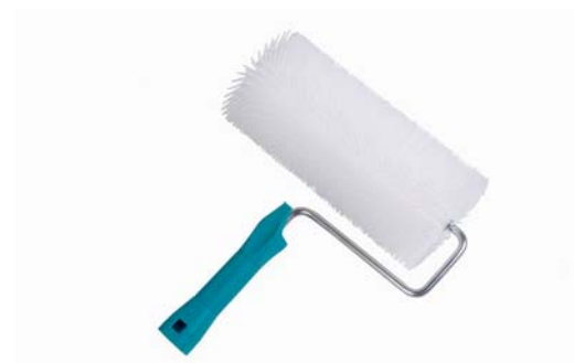
Figure 2 - Rouleau débulleur