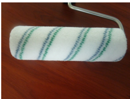
Figure 1 - Rouleau TYPE EP 2000 spécial epoxy