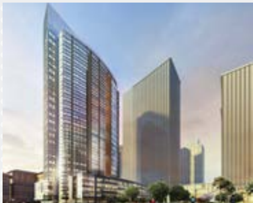
- West Gallery Place Filipinas

Desde desarrollos residenciales en zonas costeras hasta complejos industriales en regiones de alta exigencia térmica, los sistemas Boscoseal® han sido seleccionados por arquitectos, ingenieros y contratistas que buscan soluciones duraderas, eficientes y adaptables a los más altos estándares internacionales.