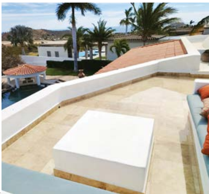
Proyecto Residencial de lujo: Palmilla, Los Cabos, Mx. SISTEMA BOSCOSEAL PU TRANSPARENTE (Primario Alifático + PU-Transparente + Acabado Mate)