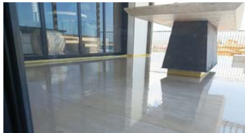
Proyecto: Hacienda Beach Club & Residences, Cabo San Lucas, Mx. SISTEMA BOSCOSEAL PU TRANSPARENTE (Primario Alifático + PU-Transparente + Acabado Mate)