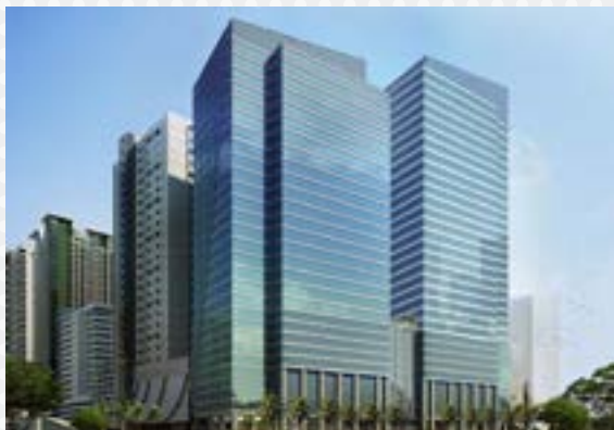
- Stiles Enterprise Plaza Filipinas