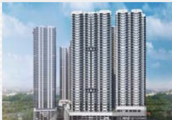
- Razak City Residences Malasia