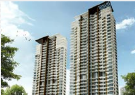
- Marinox Sky Villas Malasia