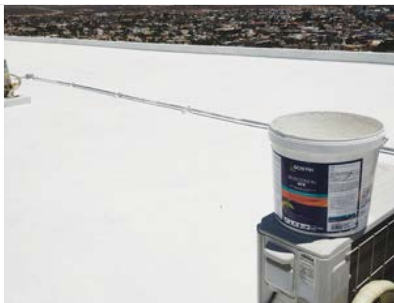
Proyecto: Montemar Luxury Residences, Cabo San Lúcas, Mx. SISTEMA BOSCOSEAL USO RESIDENCIAL (Primario 1C + Boscoseal WX)