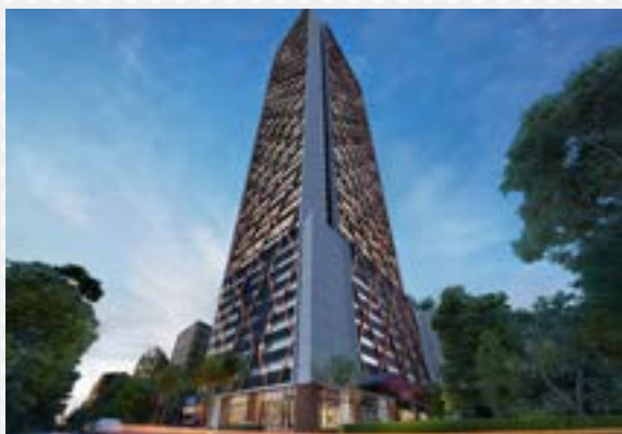
- Scarletz Suites Filipinas