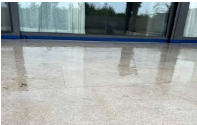
Proyecto: Solaz Luxury Collection Resort, Los Cabos, Mx. SISTEMA BOSCOSEAL PU TRANSPARENTE (Primario Alifático + PU-Transparente + Acabado Mate)