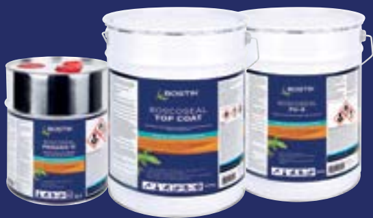
Proyecto: Villas Pueblo Bonito, Cabo San Lucas SISTEMA BOSCOSEAL USO EXTREMO (Primer 1C + PUX Blanco + PUX Gris + Top Coat)