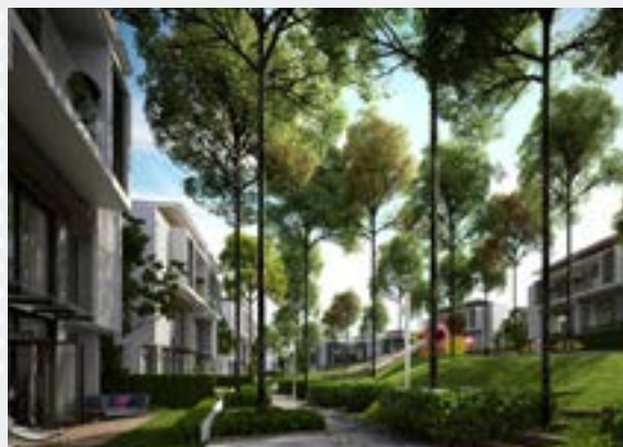
- Sejati Residences Malasia