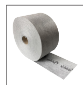
Fita de reforço