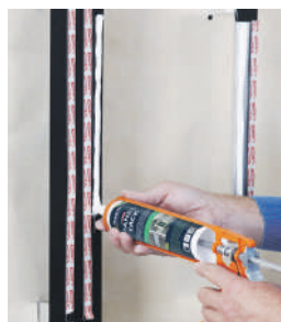
Paso 4: Aplicar el adhesivo