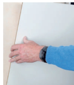
Paso 5: Instalar el panel