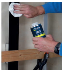
Paso 1: Limpiar / imprimir el rastrel