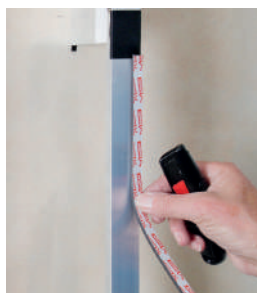
Paso 3: Colocar la cinta Foam Tape