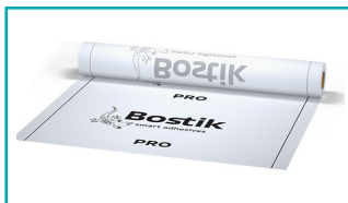
Bostik Folie PRO 1,0 x 30 m