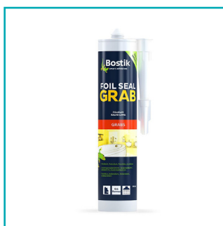
BOSTIK Foil Seal Grab 290 ml