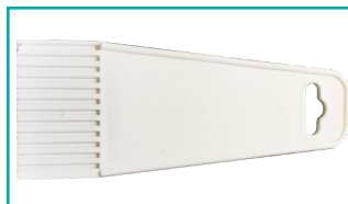
Limspridare 52 mm