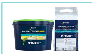
Bostik Foilseal Cement 2K