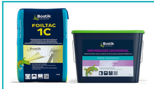
BOSTIK Foiltac 1C BOSTIK Membrane