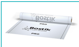
Bostik Folie PRO 1,0 x 30 m = 30m 2