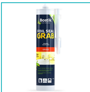
BOSTIK Foil Seal Grab 290 ml