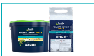
Bostik Foilseal Cement 2K