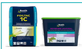
BOSTIK Foiltac 1C BOSTIK Membrane