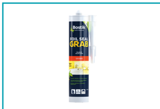
Foil Seal Grab