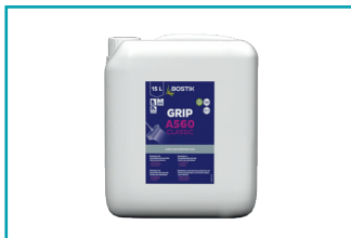
GRIP A560 Classic