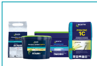
Foiltac 1C, Foil Seal Cement 2K eller Membrane