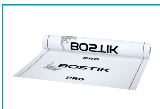
Folie PRO LX