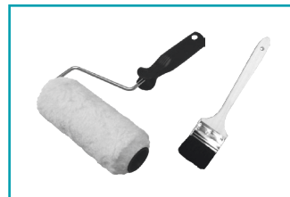
Roller / pensel