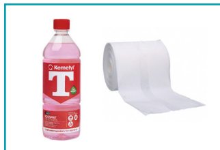
Fettlösande medel och trasor