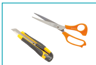
Sax / Kniv