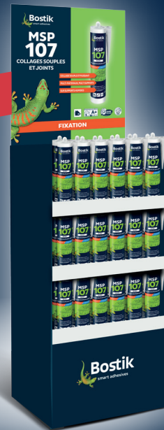
MSP 107 Box 60 cartouches en coloris Blanc ou Gris