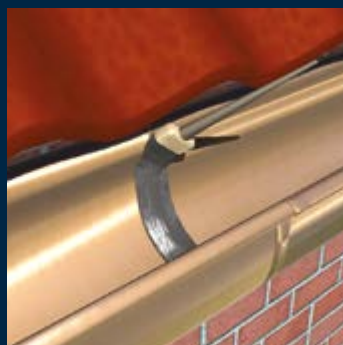
Reparatie van dakgoot en rondom schoorsteen