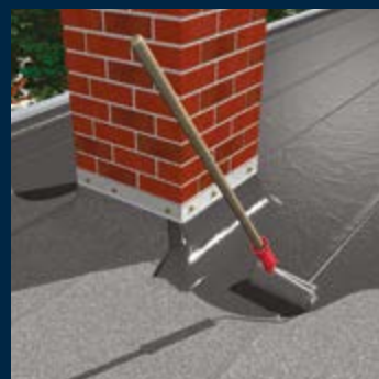
Reparatie oude Bitumen lagen