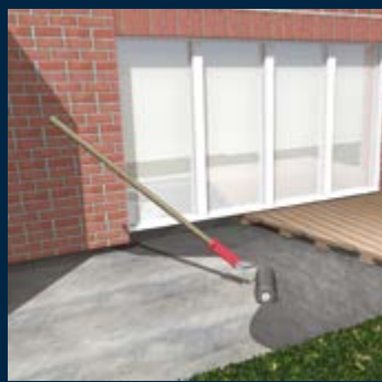
Waterdichte laag Betonnen vloer